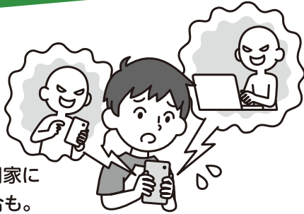
パソコンや携帯電話等を使ったいじめの認知件数